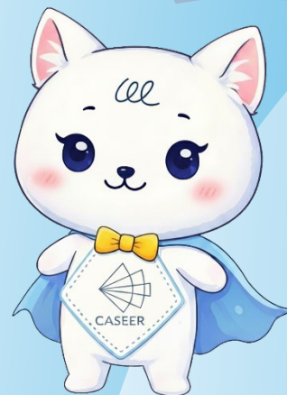
CASEER公式キャラクター きゃしゃん。

※詳しくは、学生支援チーム（大学院担当）のウェブサイトまたはCASEERウェブサイトの募集要項・応募用紙を確認してください。